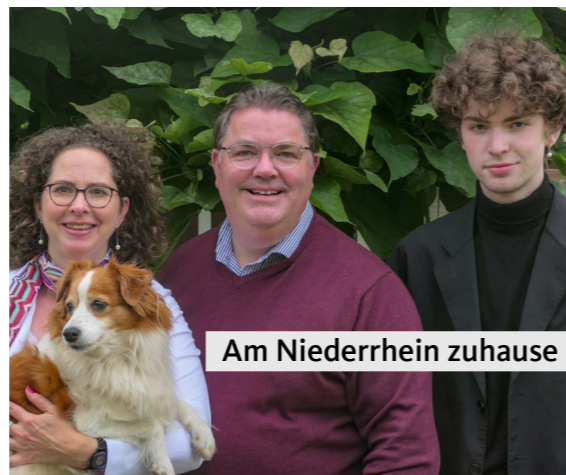
Am Niederrhein zuhause