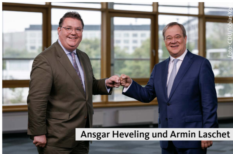
Ansgar Heveling und Armin Laschet