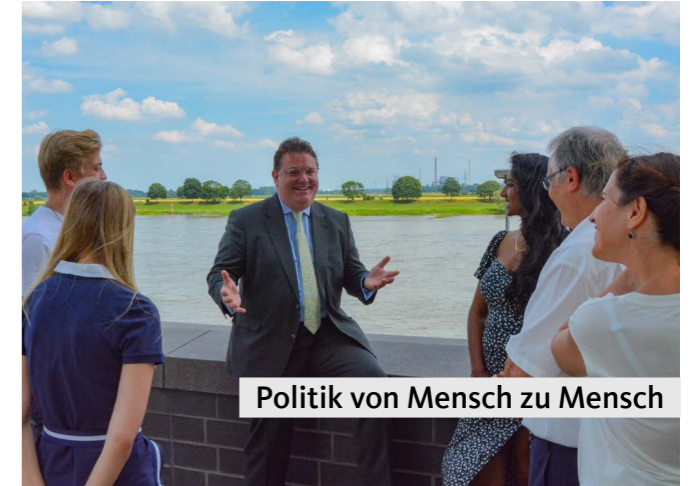
Politik von Mensch zu Mensch

Als Justiziar der CDU/CSU-Bundestagsfraktion gehöre ich dem Geschäftsführenden Fraktionsvorstand und damit der engsten Fraktionsführung an. Mit der Zuständigkeit für die Streitsachen vor dem Bundesverfassungsgericht gehören verfassungsrechtliche Grundsatzfragen ebenso zu meiner Arbeit wie die Vorbereitung der Wahl der Richterinnen und Richter zu den obersten Gerichtshöfen des Bundes als Obmann der CDU/CSU im Richterwahlausschuss.